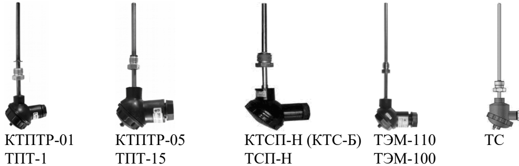
Рисунок 6 – Преобразователи температуры