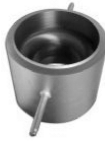
Сопло ИСА 1932