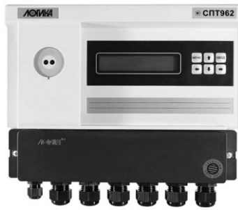
Рисунок 1 – Тепловычислитель СПТ963 (СПТ962, СПТ961)