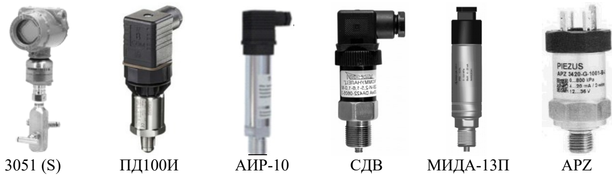
Рисунок 5 (продолжение) – Преобразователи давления и разности давлений